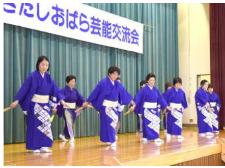
北山スポーツ民謡愛好会のみなさん