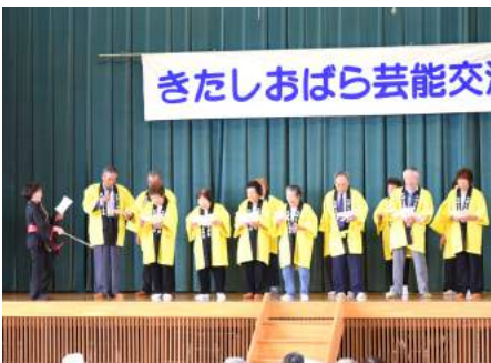
桧原長寿会のみなさん