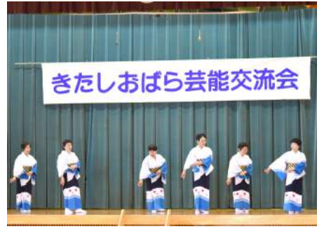
裏磐梯長寿会のみなさん