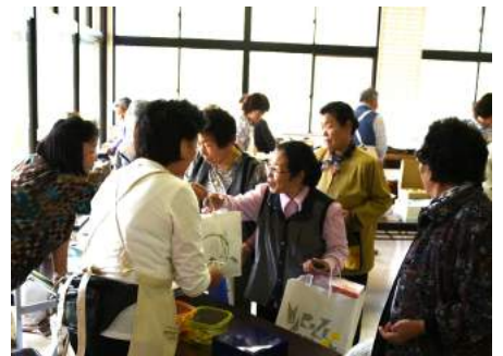
赤十字奉仕団福祉バザー