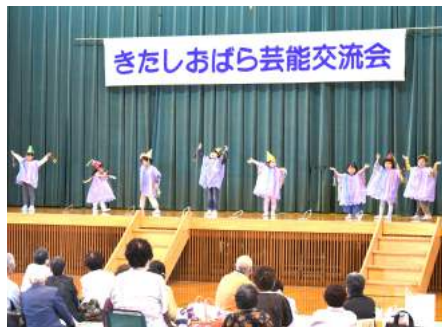
裏磐梯幼稚園の園児たち