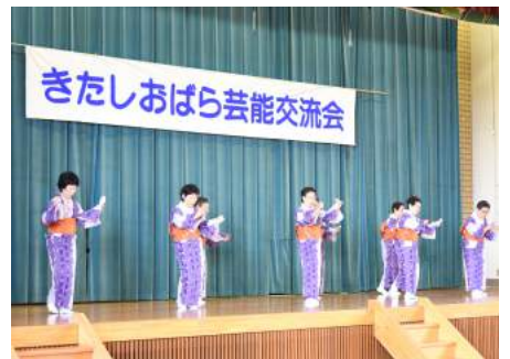
大塩スポーツ民謡愛好会のみなさん