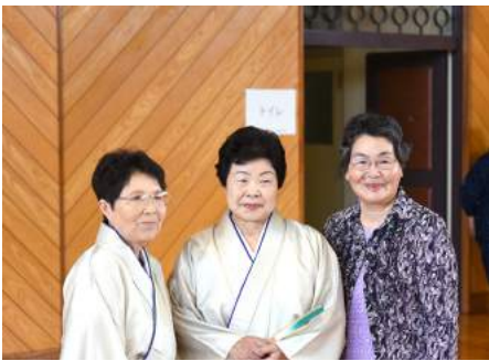
豊踊会のみなさん(大塩)