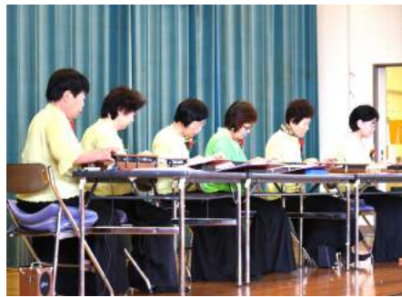
大正琴愛好会のみなさん