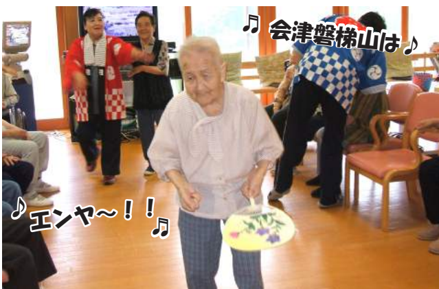
♪ 会津磐梯山は ♪