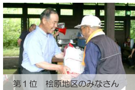
第1位 桧原地区のみなさん