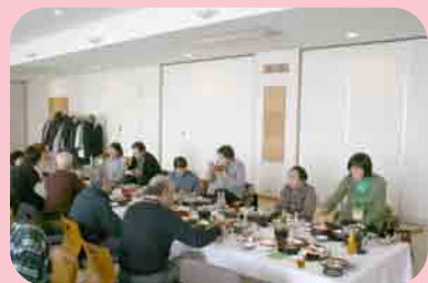
民生委員さんとも話が弾みます