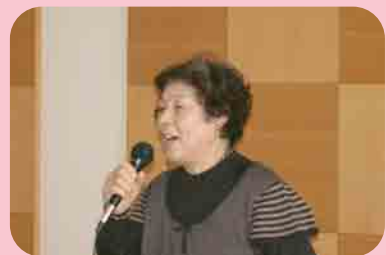
トリを務めていただきました