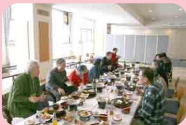
久しぶりに会えたね！