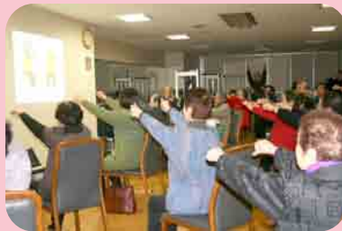
いきいき百歳体操