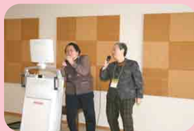
地区を越えたデュエット