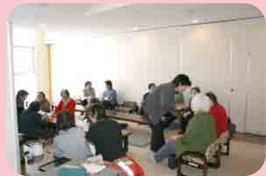
楽しいお茶のみタイム