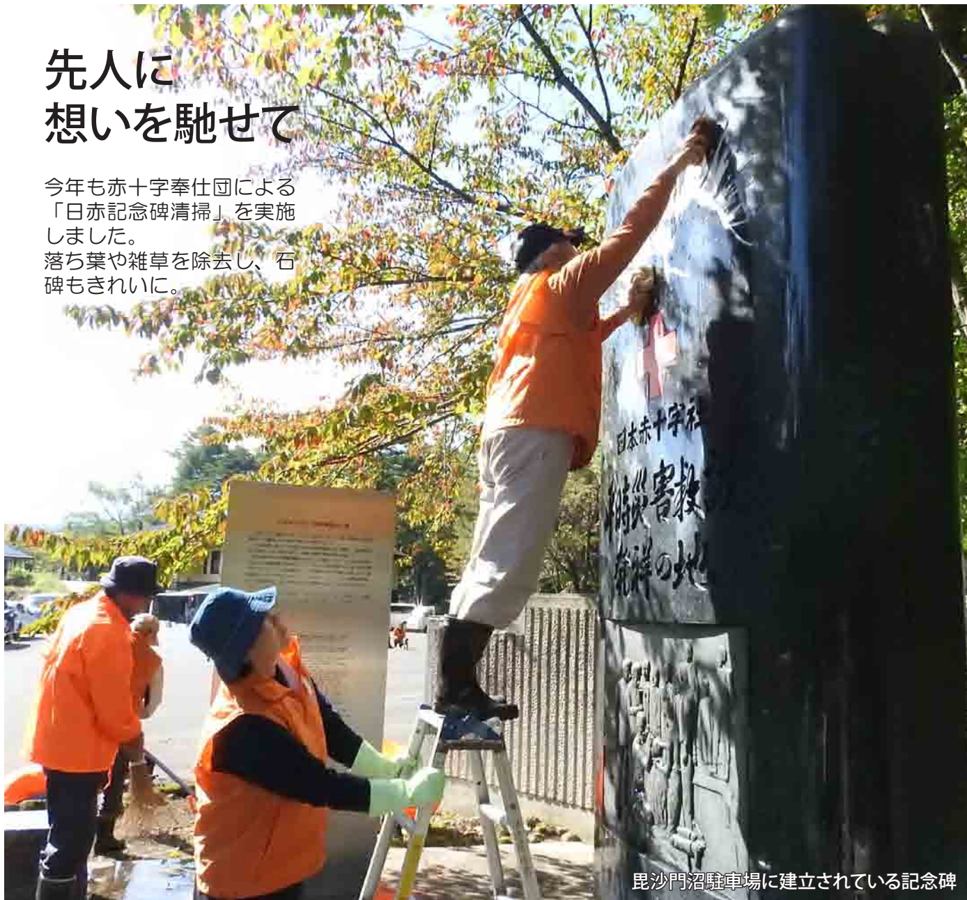
毘沙門沼駐車場に建立されている記念碑

今年も赤十字奉仕団による 「日赤記念碑清掃」を実施 しました。 落ち葉や雑草を除去し、石 碑もきれいに。