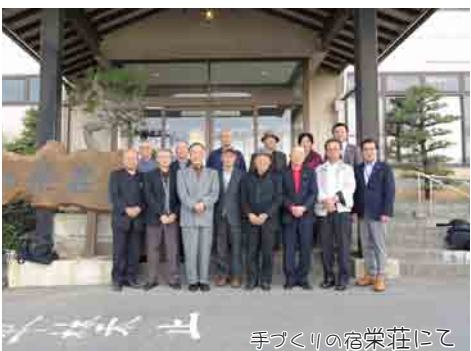
手づくりの宿栄荘にて