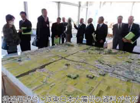
役場展望台には東日本大震災の資料が並び

ただきました。松川浦の「栄荘」に宿泊し2日目は国道6号線沿いをいわき方面へ。復興状況を車窓から見学しました。