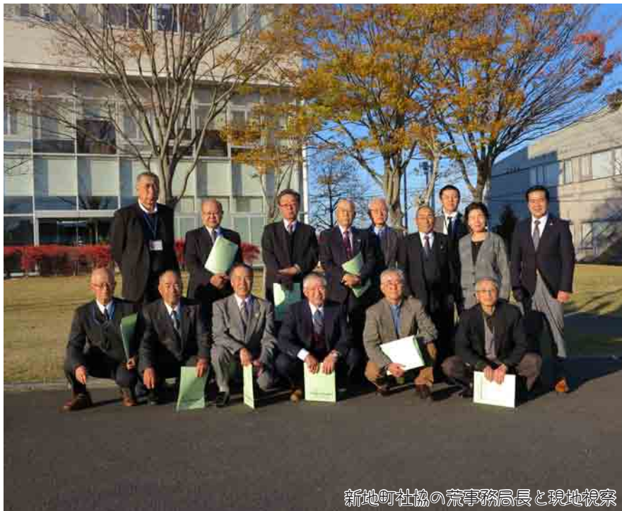
新地町社協の荒事務局長と現地視察