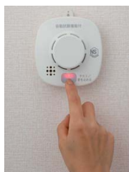
(例) ボタンを押すタイプ

◆警報器の寿命は、約10年です。設置後に10年が経過する前に、新しいものに取り換えてください。(製造年月日は本体に記載)