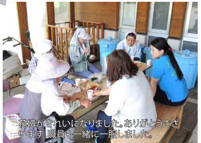
花壇がきれいになりました。ありがとうございます。職員も一緒に一服しました。