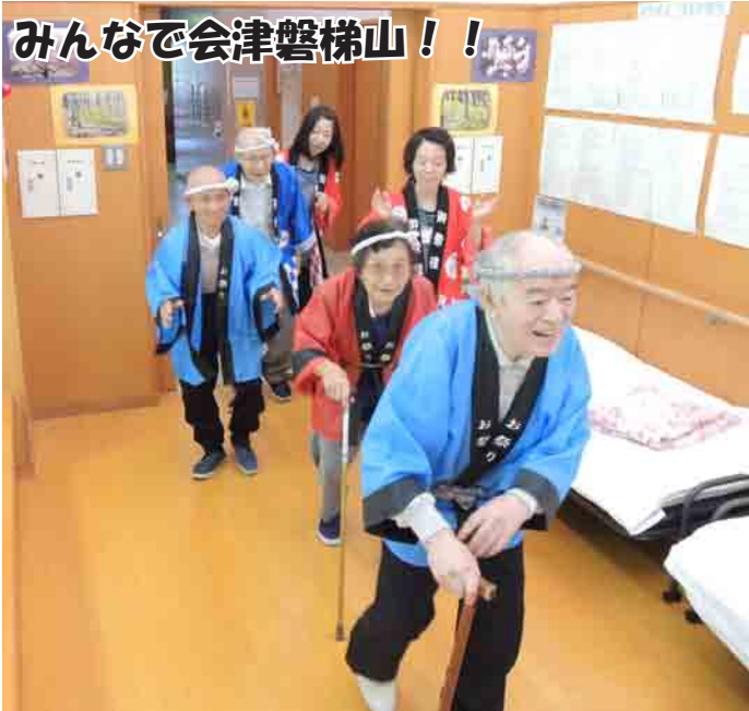
みんなで会津磐梯山！！