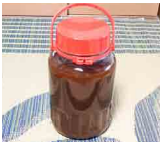
ブルーンジュース