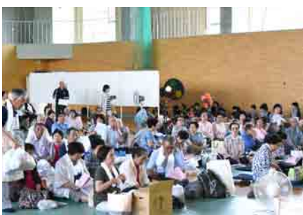
来場者のみなさん