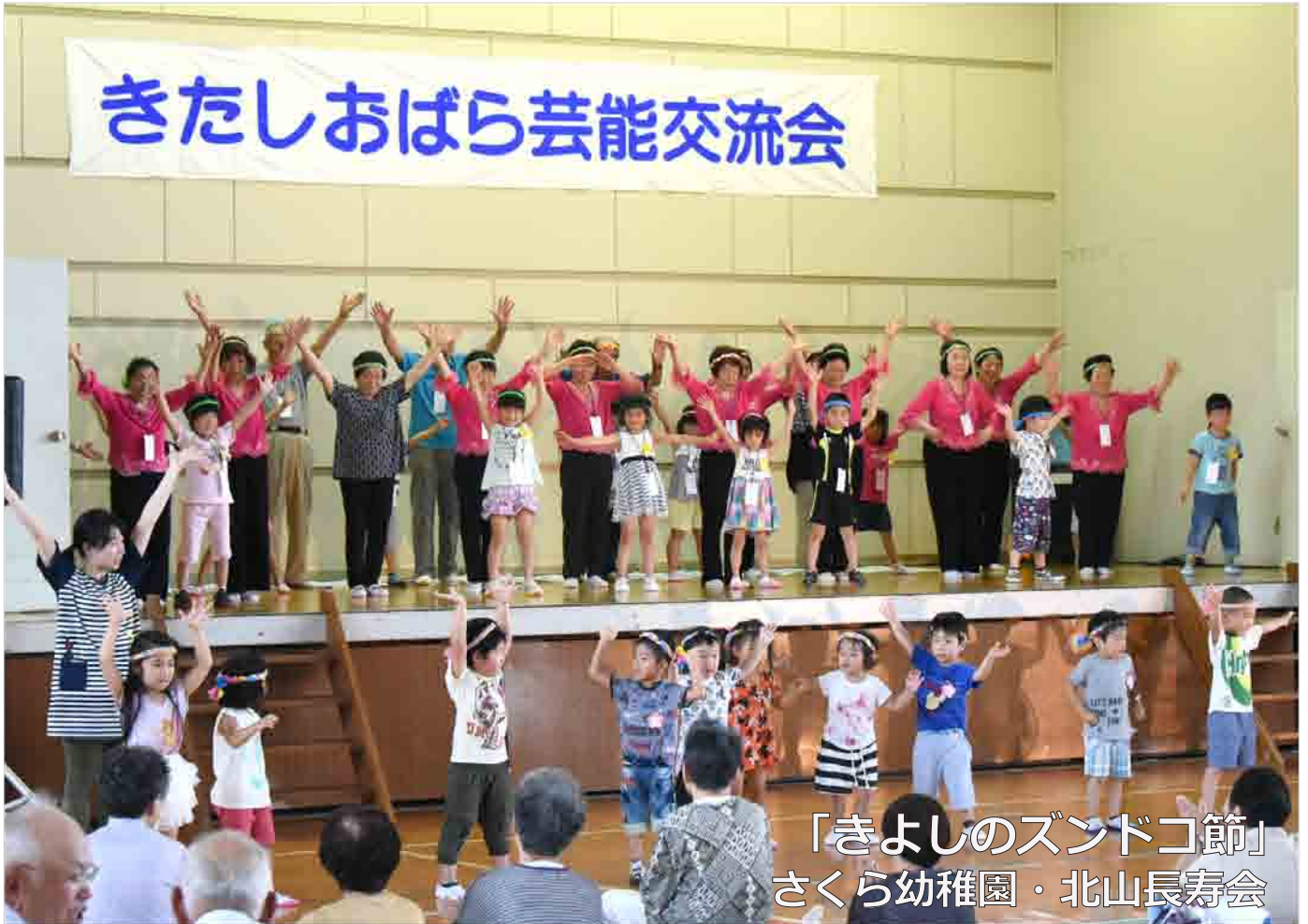
「きよしのズンドコ節」 さくら幼稚園・北山長寿会

7月11日（火）北塩原村民体育館にて「きたしおばら芸能交流会」を開催しました。参加者は約180名。発表のほかに赤十字奉仕団による福祉バザーや会津ヤクルト販売株式会社さん、いいで工房さんによる商品販売も実施されました。演目は唄や踊りが中心となって、発表ごとに会場は熱気に包まれました。一年間の練習の成果を十二分