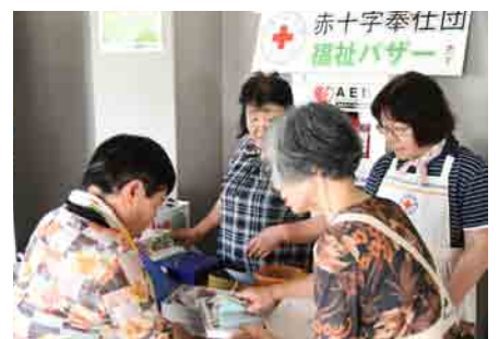
赤十字奉仕団福祉バザー