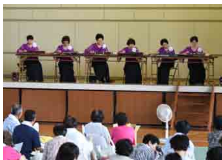
大正琴愛好会のみなさん