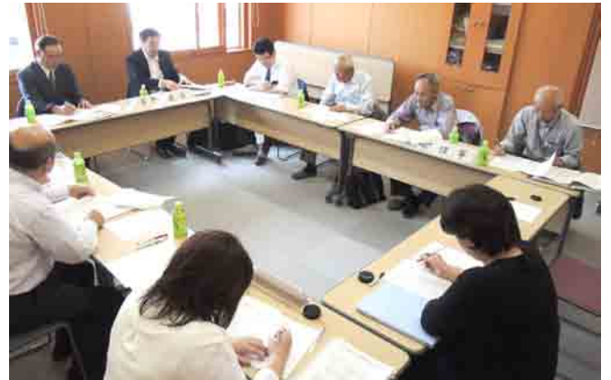
任期：平成31年6月下旬まで／敬称略

6月29日(木)開催。議案は会長及び副会長の選出について、評議員選任・解任委員会委員の欠員補充についてで、新役員体制は下記の通り決定しました。また、新たに理事及び監事に就任いただいた皆様に委嘱状を交付しました。