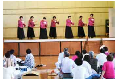
裏磐梯長寿会のみなさん