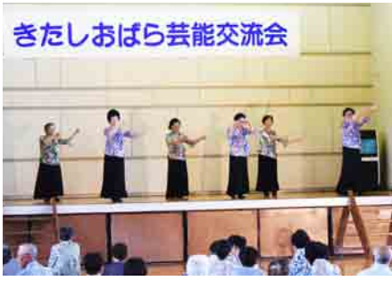
きたしおばら芸能交流会 大塩スポーツ民謡愛好会のみなさん