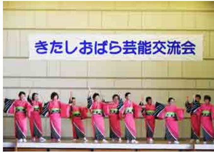
きたしおばら芸能交流会 北山スポーツ民謡愛好会のみなさん