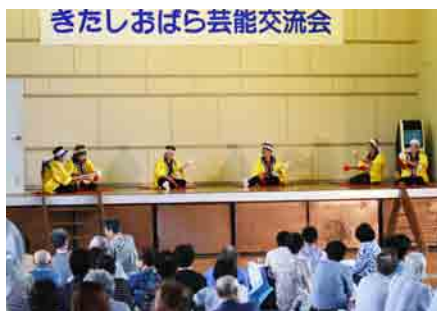
きたしおばら芸能交流会 松原長寿会のみなさん