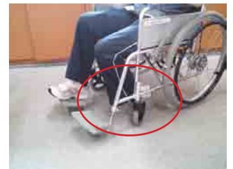
足の落下による巻き込み

フットレスト ※板の上をしっかり足が載っているか操作前、操作後に確認する。 ※絶対に板の上には立たない。