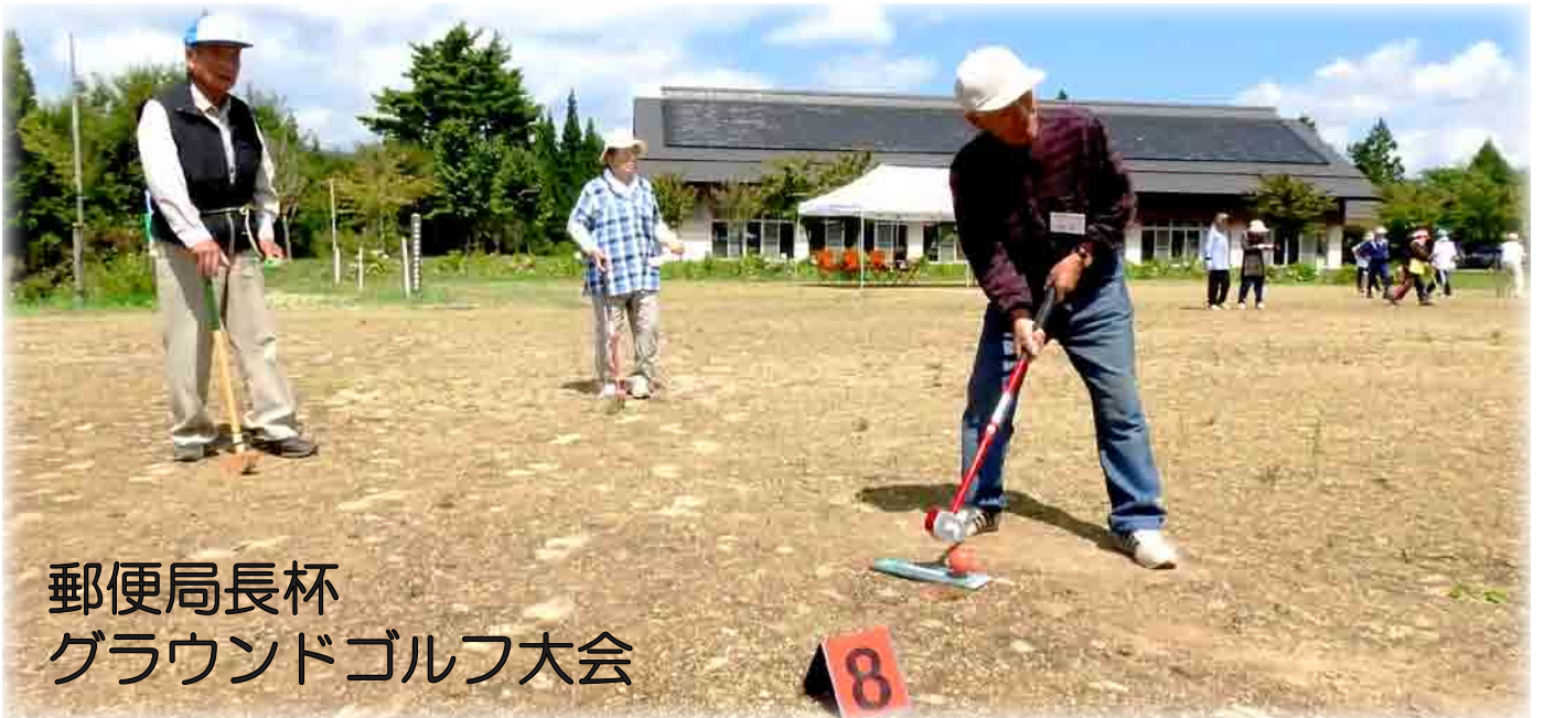
郵便局長杯 グラウンドゴルフ大会