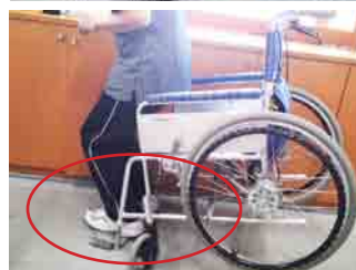
板の上の立ち上がり