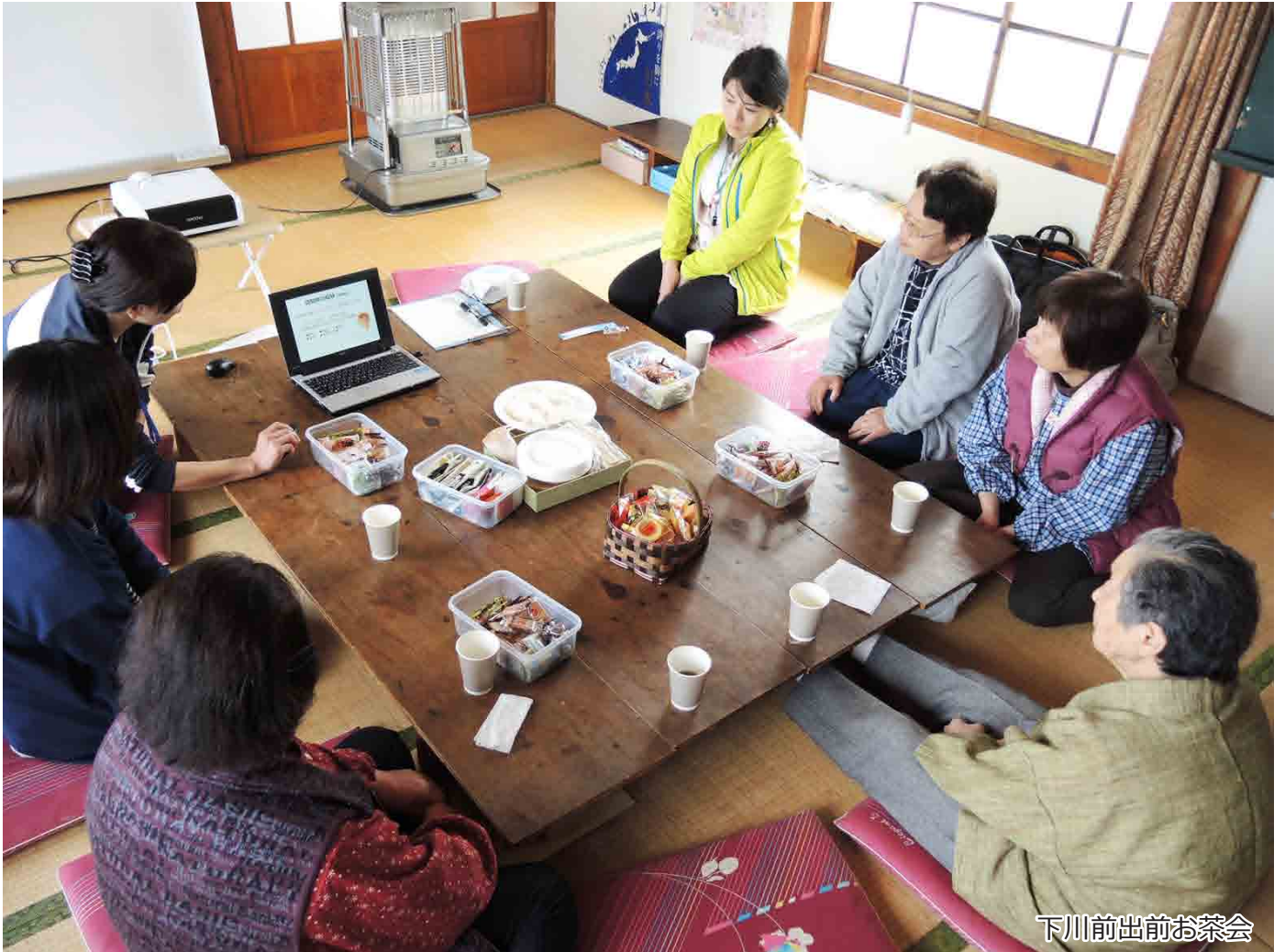
下川前出前お茶会