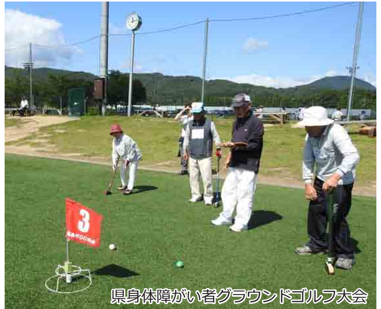
県身体障がい者グラウンドゴルフ大会

障がい者の自立と更生を目的に活動しています。障がいをお持ちの方であればどなたでも会員とすることができますので、詳しくは社会福祉協議会事務局まで。