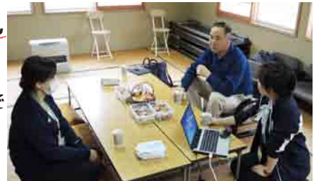
社協『あふたぬ〜んてい』の会