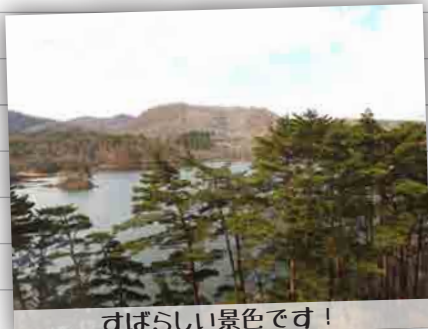
すばらしい景色です!