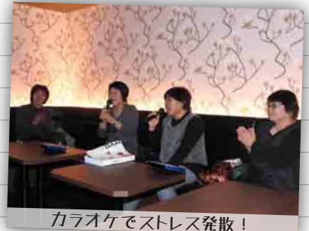
カラオケでストレス発散!