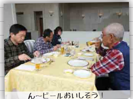
ん〜ビールおいそう!