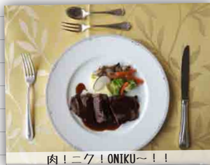
肉! ニク! ONIKU〜!!