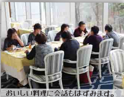
おいしい料理に会話もはずみます。