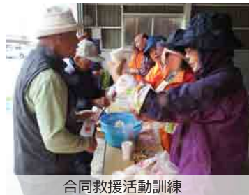
合同救援活動訓練