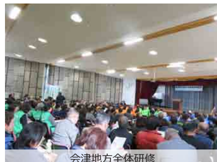
会津地方全体研修