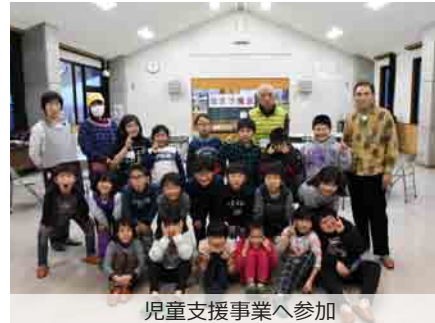
児童支援事業へ参加