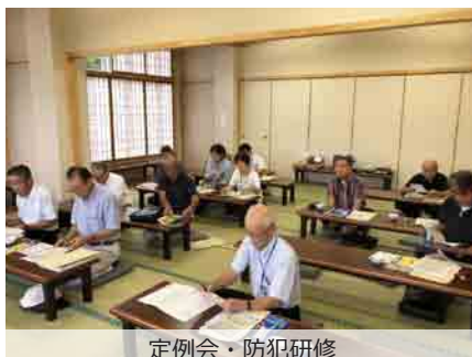
定例会・防犯研修