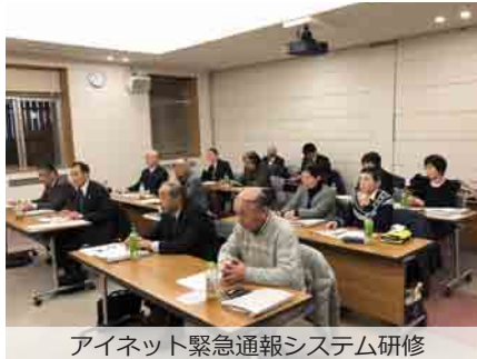
アイネット緊急通報システム研修

皆様が普段生活するうえでの困りごとがあった場合、解決できるようにお手伝いをします。