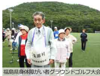
福島県身体障がい者グラウンドゴルフ大会

障がい者の自立と更生を目的に活動しています。障がいをお持ちの方であればどなたでも会員とすることができますので、詳しくは社会福祉協議会事務局まで。