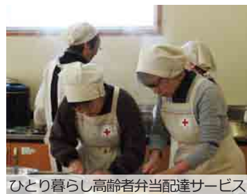
ひとり暮らし高齢者弁当配達サービス