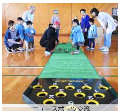
ニュースポーツ交流