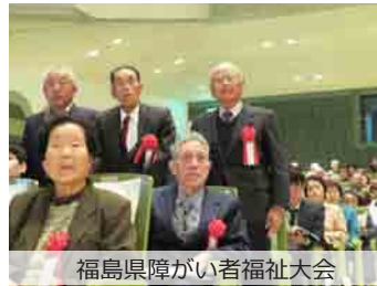
福島県障がい者福祉大会