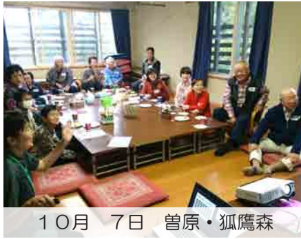
10月 7日 曾原・狐鷹森