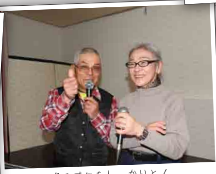
カラオケもしっかりと! 楽しかったですね~。