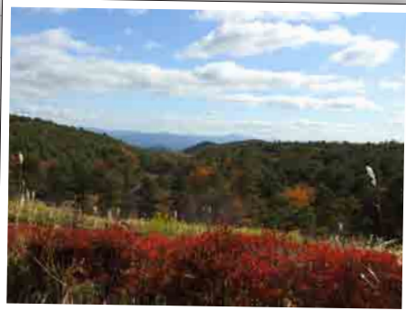
道中の道の駅つちゆにて。 とってもいい天気でした~。