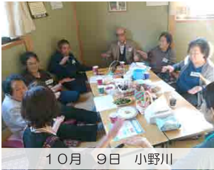
10月 9日 小野川