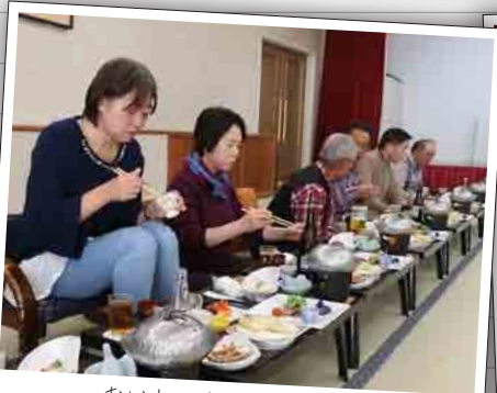
おいしいお料理を堪能。 ゆっくりと味わいました~。