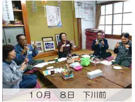
10月 8日 下川前