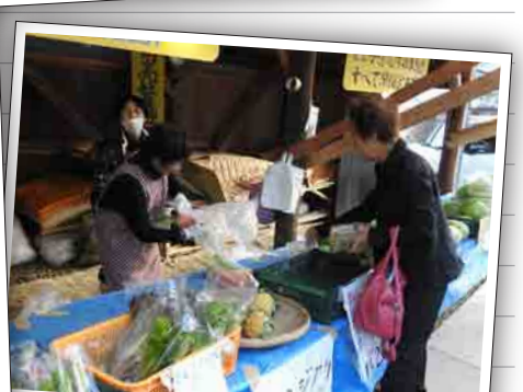
お土産も忘れません! 高森の直売所でお買い物~。

*この事業は、要支援及び要介護判定を受けている方を、ご自宅で介護されている方を対象とした事業です。