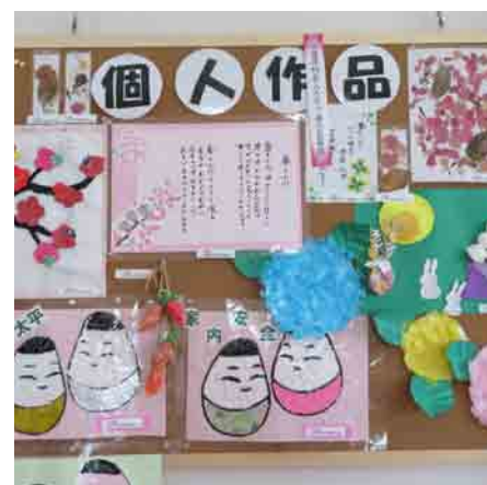
北塩原村老人クラブ連合会長賞 「日々の成果」 GHさくら様（北山）

この表彰は、65歳以上の高齢者の方が文化祭に出展されている作品を対象に実施しているものです。北山・大塩（さくらふれあい文化祭）と桧原・裏磐梯（裏磐梯文化祭）で1年交代で実施しています。来年度は裏磐梯文化祭にて実施予定ですので、たくさんの出展をお待ちしております！