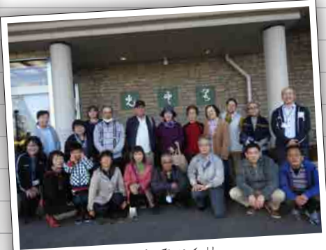
みんなでパチリ。 岳温泉の光雲閣さん、お世話になりました!