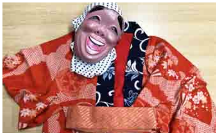
ひよっとこセット 手づくりお面が素敵です