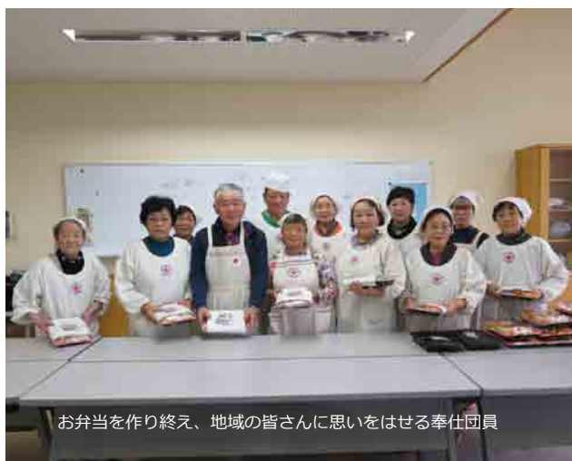
お弁当を作り終え、地域の皆さんに思いをはせる奉仕団員

今年度最後となる6回目の弁当づくりを11月25日（月）に実施しました。アイデア盛りたくさん、旬の食材を使った献立は大好評！！また来年お届けしますのでお待ちください。