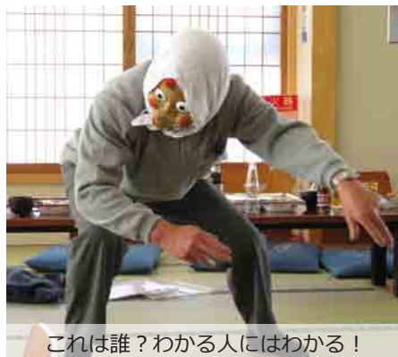
これは誰？わかる人にはわかる！