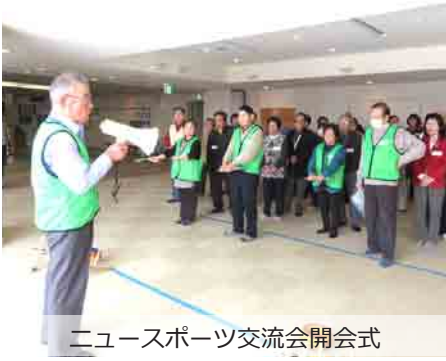
ニュースポーツ交流会開会式