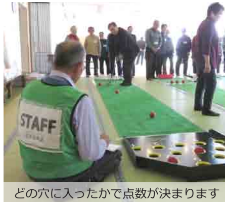
どの穴に入ったかで点数が決まります