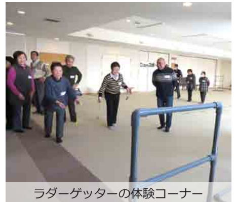
ラダーゲッターの体験コーナー