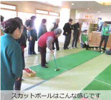
スカットボールはこんな感じです