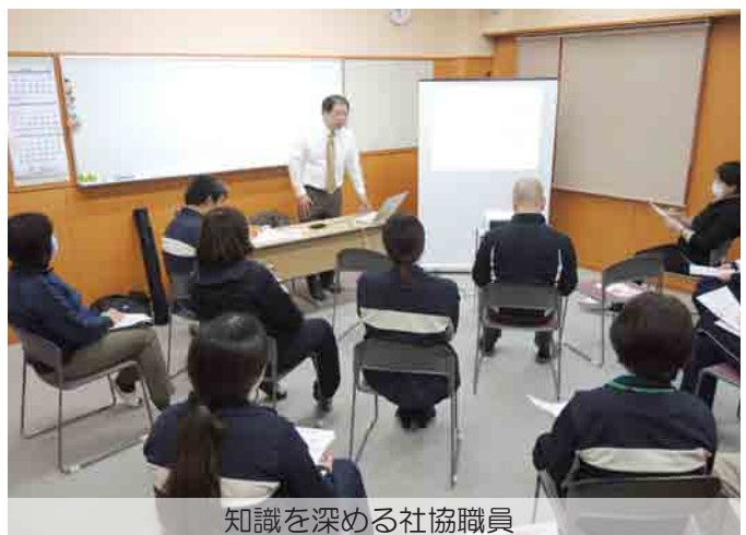
知識を深める社協職員