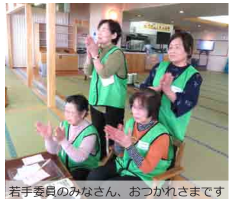
若手委員のみなさん、おつかれさます