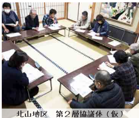
北山地区 第2層協議体（仮）