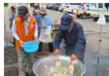
合同救援活動訓練