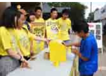
サマーショート ボランティア