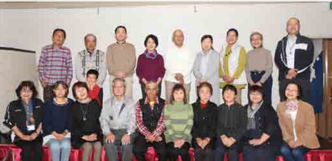
家族介護者リフレッシュ事業