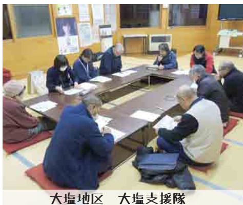
大塩地区 大塩支援隊