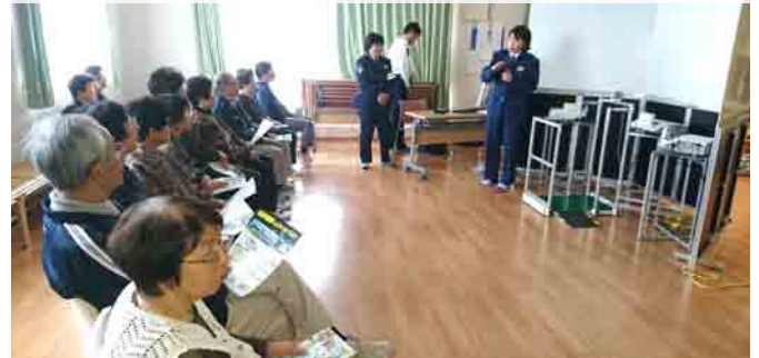
交通安全教室への協力