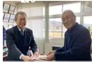
渡部会長から第一中学校へ