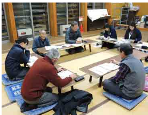
松原地区 あづまっぺ

村内4カ所で第2層協議体構成員が各地区10名程度集まり、顔合わせをして1回目の会議を開催しました。会議では、地域での困りごとやこんなことあったらいいな！を話し合い、活動していく予定です。