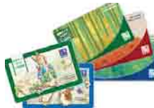
福祉図書購入助成

配分委員（民生委員）によって、生活困難世帯への見舞金や歳末福祉事業費として配分されます。