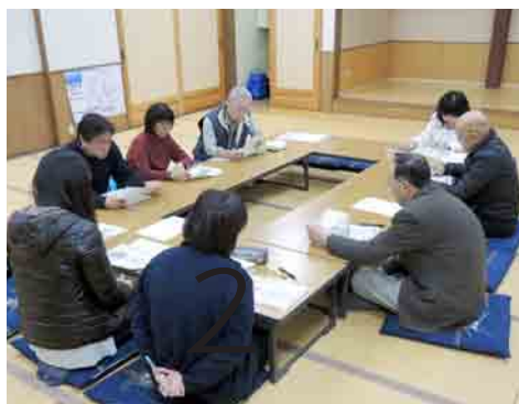
裏磐梯地区 オール裏磐梯