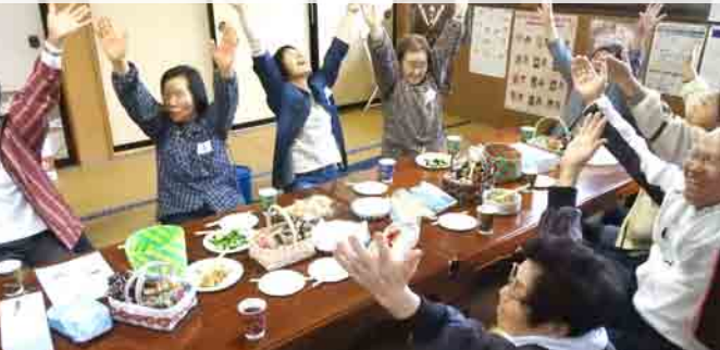
『春の出前お茶会』脳の若返り講座