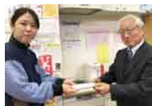
歳末たすけあい募金 配分金配分