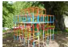
遊具の設置・修繕