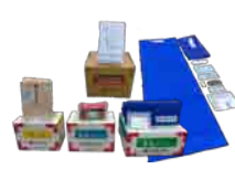
国内外の災害時 救援物資の支援