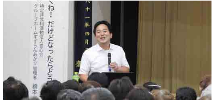
認知症に関する講演会