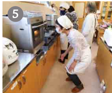
5 サバは焼けたかな～