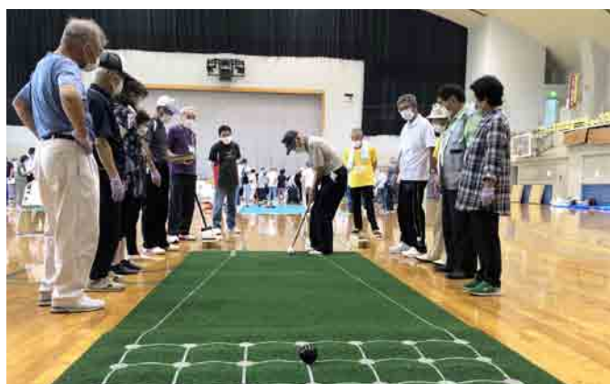
囲碁ボールの様子