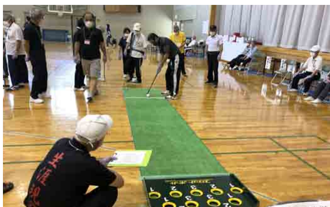
スカットボールの様子