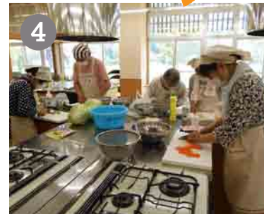
4 ちらし寿司の具をつくる