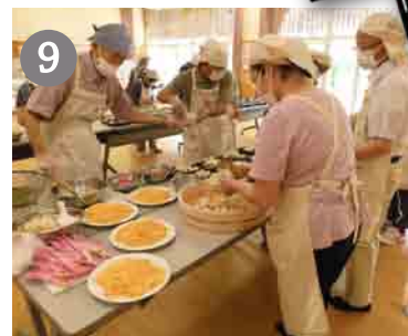
9 流れ作業であっという間