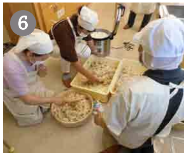
6 ちらし寿司の完成