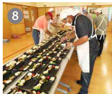
8 出来たものから盛付け