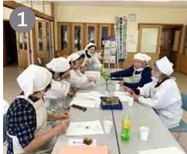
1 役員会で献立を考えて、 買い物の準備もします。