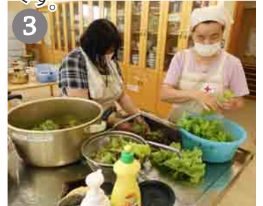
3 野菜を洗って水気をとる