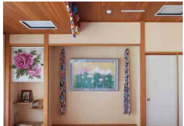
デイサービスの床の間に飾りました。