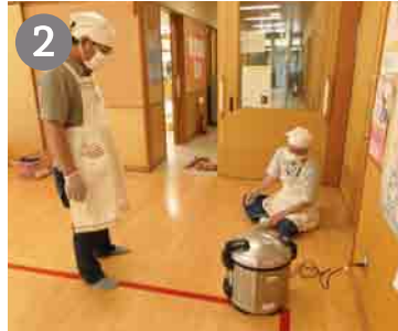
2 お米を炊きますよ～