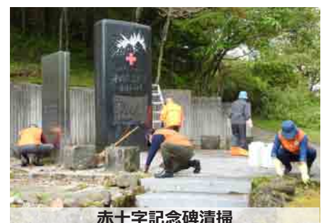
赤十字記念碑清掃