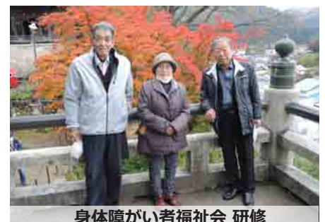
身体障がい者福祉会 研修