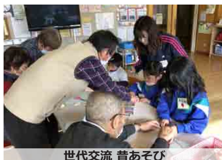
世代交流 昔あそび