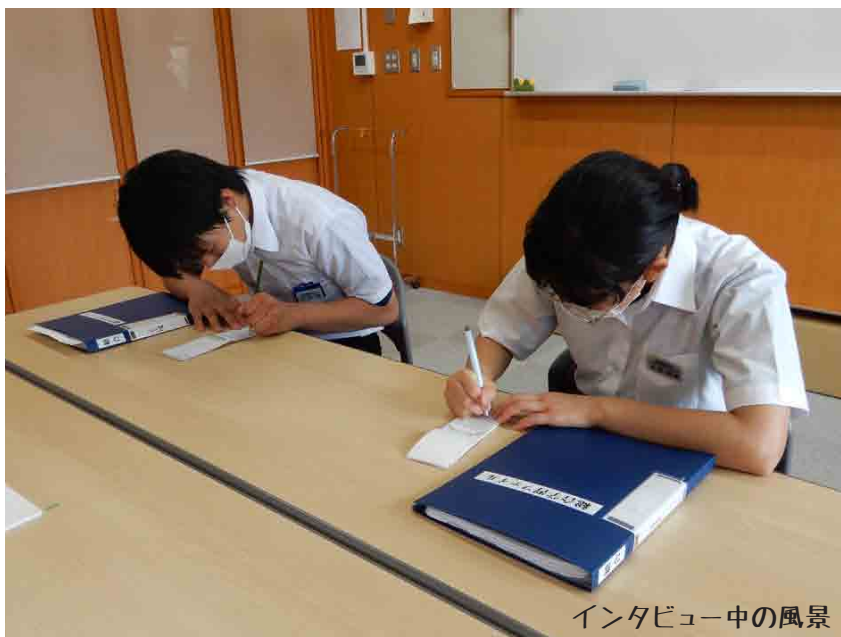
インタビュー中の風景