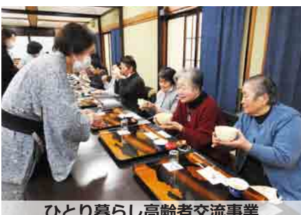
ひとり暮らし高齢者交流事業