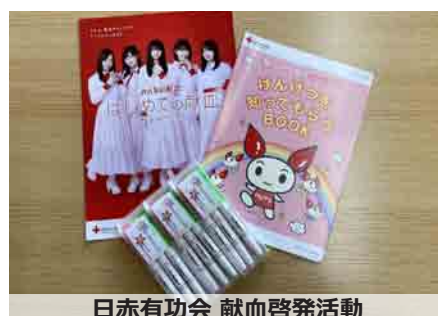
日赤有功会 献血啓発活動