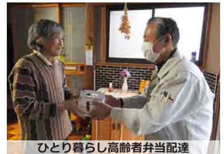
ひとり暮らし高齢者弁当配達