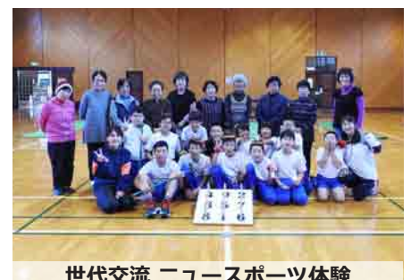
世代交流 ニュースポーツ体験