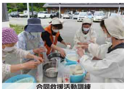
合同救援活動訓練