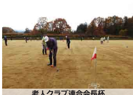
老人クラブ連合会長杯