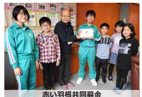
赤い羽根共同募金