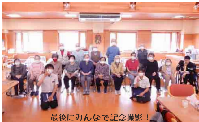
最後にみんなで記念撮影!