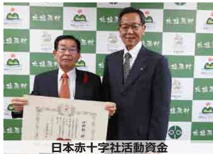
日本赤十字社活動資金