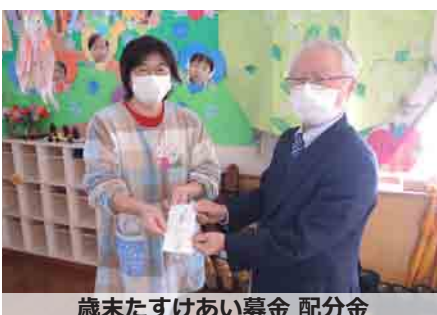
歳末たすけあい募金 配分金