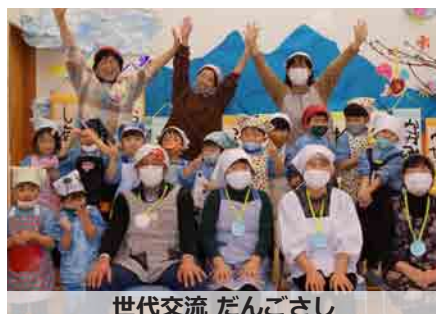
世代交流 だんごさし