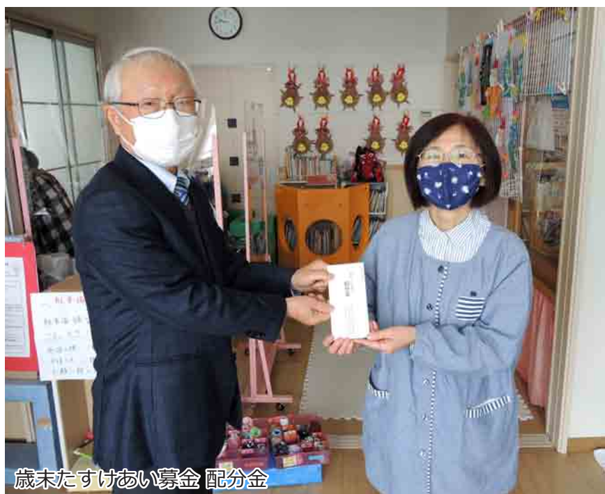
歳末たすけあい募金 配分金

民生児童委員には「 守秘義務 」があり、皆様からお話しいただいた内容を外部に漏らすことはありません。