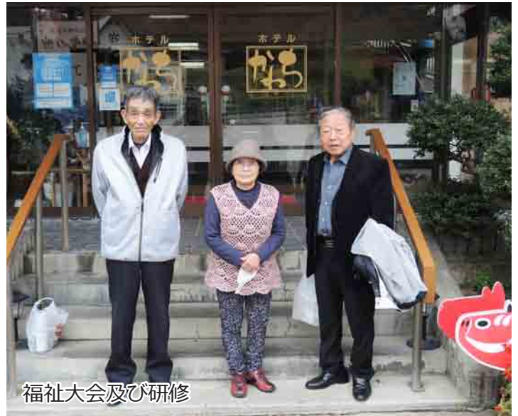
福祉大会及び研修

障がい者の自立と更生を目的に活動しています。障がいをお持ちの方であればどなたでも会員とすることができますので、詳しくは社会福祉協議会事務局まで。