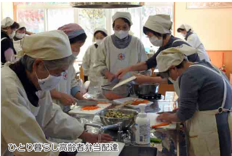
ひとり暮らし高齢者弁当配達