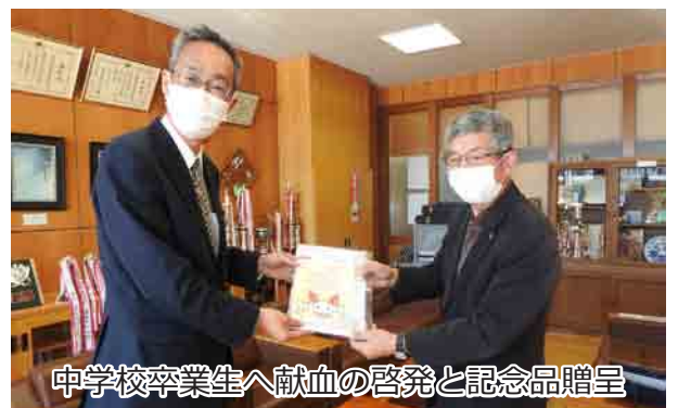
中学校卒業生へ献血の啓発と記念品贈呈