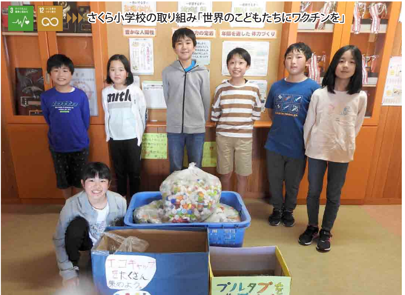
さくら小学校の取り組み「世界の子どもたちにワクチンを」