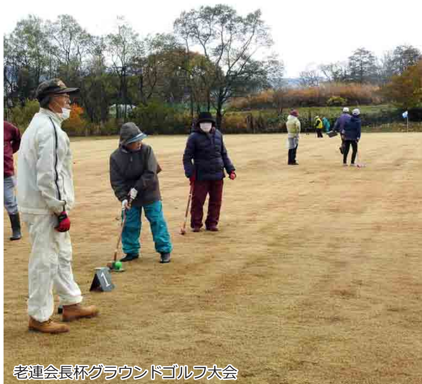
老連会長杯グラウンドゴルフ大会