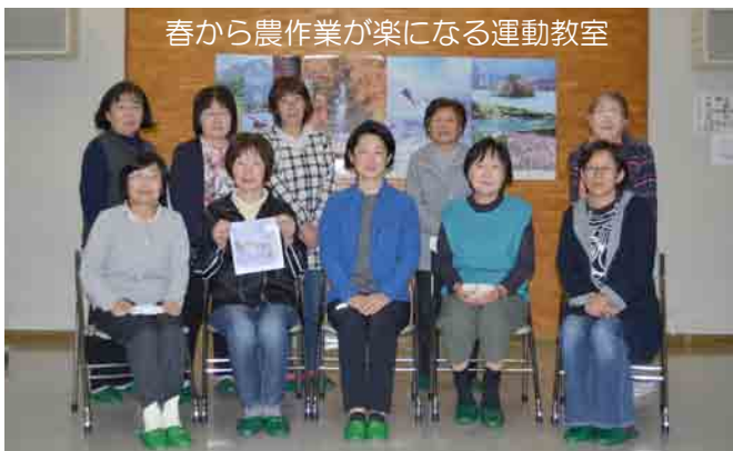
春から農作業が楽になる運動教室

内容 会員交流事業など 会員 35名 活動 通年 5~10月農繁期除く 場所 事業ごとに異なります