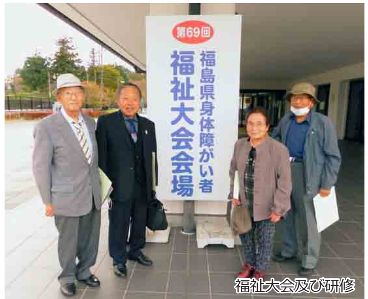
福祉大会及び研修

障がい者の自立と更生を目的に活動しています。障がいをお持ちの方であればどなたでも会員とすることができますので、詳しくは社会福祉協議会事務局まで。