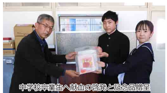
中学校卒業生へ献血の啓発と記念品贈呈