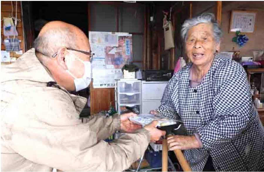
赤十字奉仕団 ひとり暮らし高齢者 弁当配達サービス