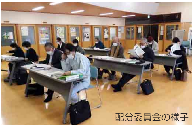
配分委員会の様子