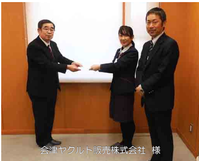
会津ヤクルト販売株式会社 様