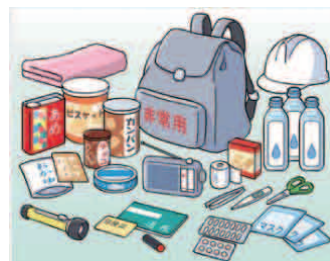
非常時持ち出し品は定期的に整理しましょう。