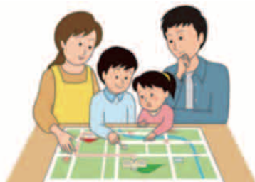
家族で防災について話し合しましょう。