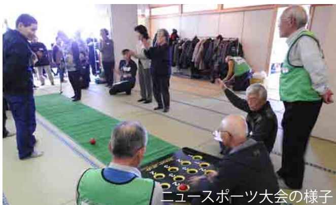
ニュースポーツ大会の様子

内容 新年お楽しみ会 ボーリング大会 他老連交流事業 他 会員 村老連 若手委員 8名