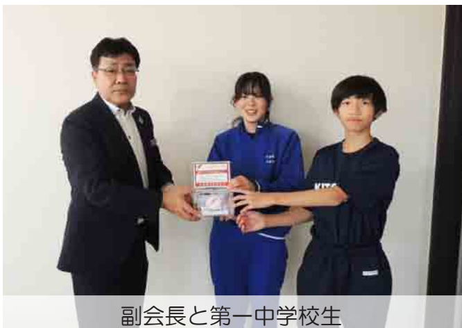
副会長と第一中学校生