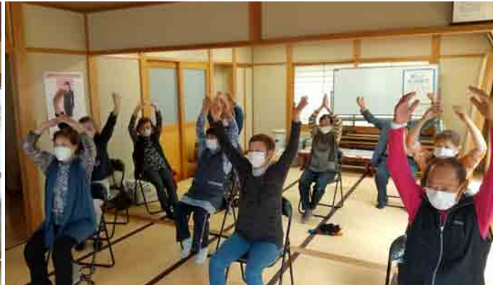
松陽台地区：「マツケンサンバ体操」