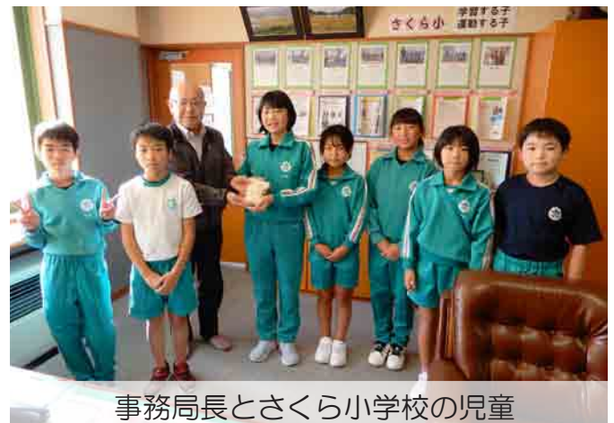
事務局長とさくら小学校の児童