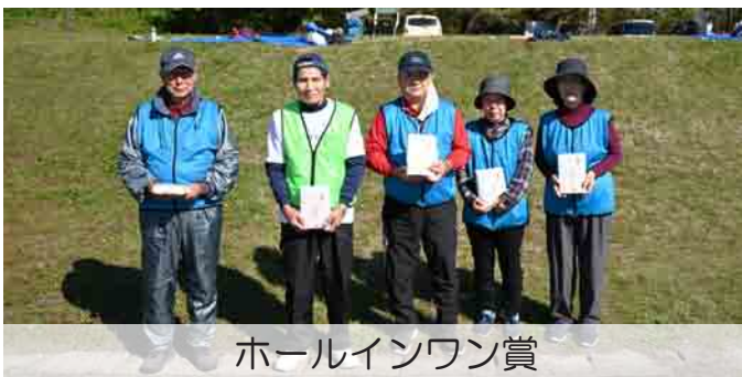
ホールインワン賞