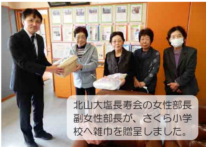
北山大塩長寿会の女性部長 副女性部長が、さくら小学 校へ雑巾を贈呈しました。