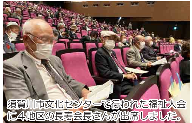
須賀川市文化センターで行われた福祉大会に4地区の長寿会長さんが出席しました。