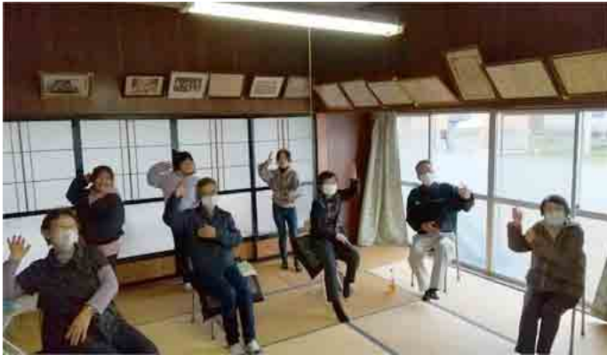
下吉地区：近所の小学生が飛び入り参加

11月6日～11月17日、20行政区集会所等にお邪魔して「出前教室」を開催しました。 介護予防・認知症予防の脳トレ・体操に、ご参加いただきありがとうございました♡