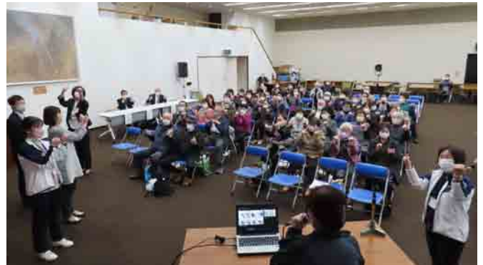
脳トレに効果抜群の指体操。職員が前でお手本を見せようと思いますが…できてるのか怪しいですね。