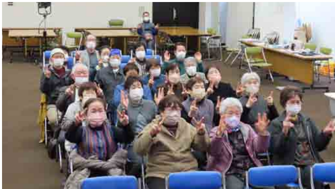
思うように指が動かず、笑い声がこぼれてきました。ぜひ家でも取り組んでみてください！