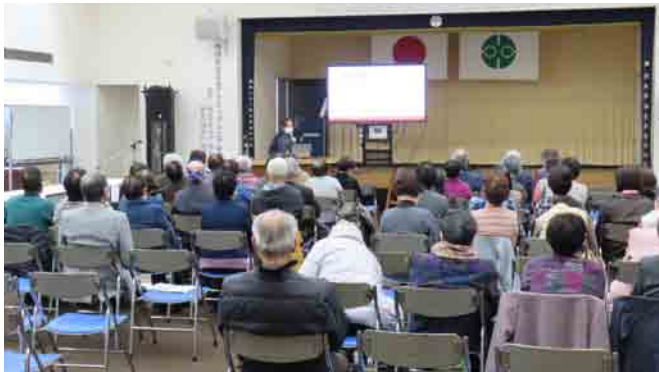
まずは、村内における介護保険サービスの状況等を認知症地域支援推進員が報告。

3月15日に開催された「第4回いきいき村民フェスティバル」の様子をご紹介します！