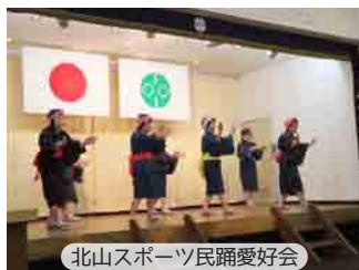
北山スポーツ民踊愛好会