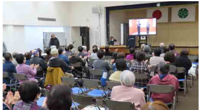
最後はみんなで「きよしのズンドコ節」の曲にあわせて介護予防体操！