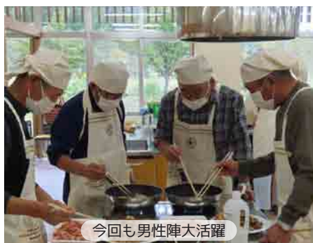
今回も男性陣大活躍