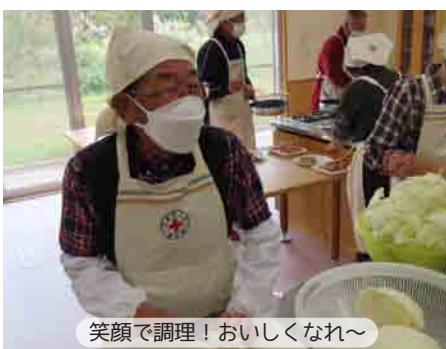
笑顔で調理！おいしくなれ～