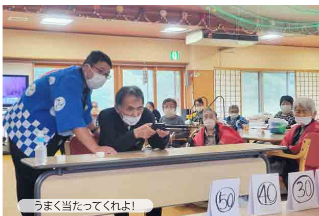
うまく当たってくれよ!