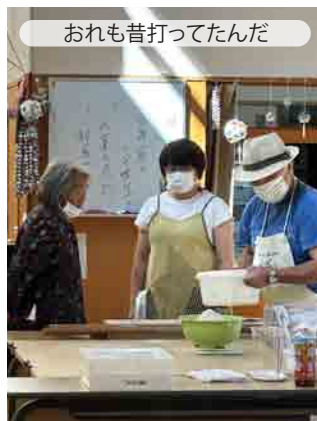
おれも昔打ってたんだ