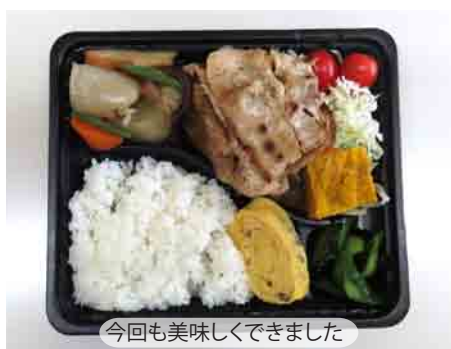
今回も美味しくできました