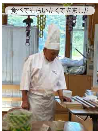
食べてもらいたくてきました