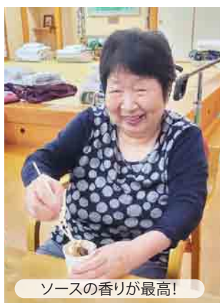
ソースの香りが最高!