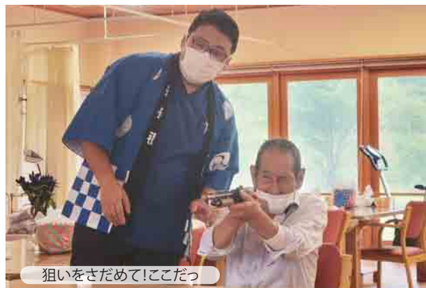
狙いをさだめて!ここだっ

あれこれ楽しんで頂きたい！とデイのスタッフが企画した2024年デイの秋まつり。射的ゲームでは『腕がなるねえ』などと競争心を掻き立て、童心に返ったように的を狙う表情が新鮮です。たこ焼き、チョコバナナ、豪華景品…と、お腹も心もわしづかみのおまつり効果でみなさん、ご覧の笑顔です。