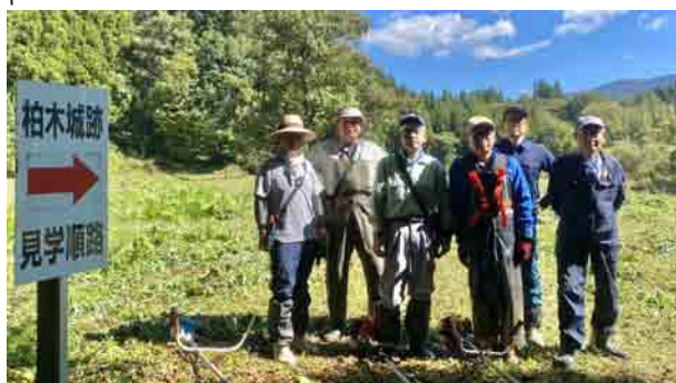
整備後すっかりキレイになった見学路にて