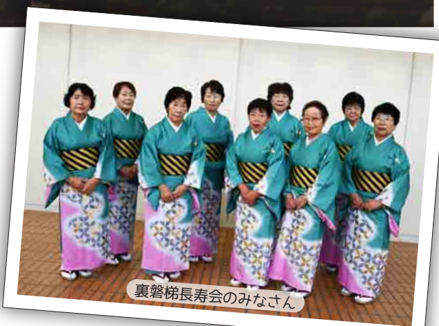
裏磐梯長寿会のみなさん

この日のために練習を重ね、迎えた本番当日。会場からたくさんの応援をいただき、見事な踊りを披露！ 裏磐梯長寿会のみなさん、とても素敵でした！