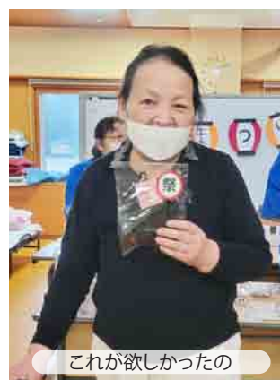
これが欲しかったの