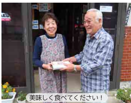
美味しく食べてください！