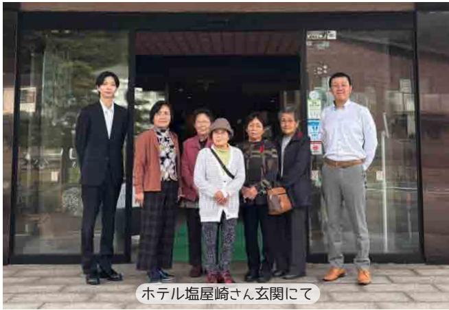
ホテル塩屋崎さん玄関にて