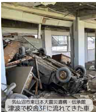
気仙沼市東日本大震災遺構・伝承館 津波で校舎3Fに流れてきた車