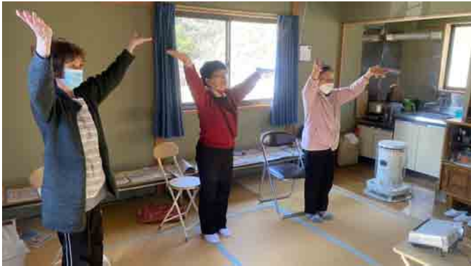
小野川行政区：皆さん踊りが上手!!

11月1日～11月15日にかけて、村内20行政区で「出前教室」を開催いたしました！ 参加者の皆さまと一緒に、介護予防・認知症予防の学習と脳トレ・体操に取り組みました。