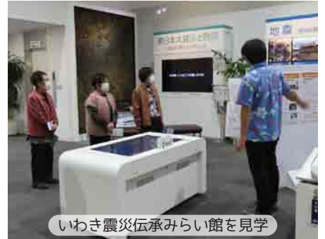
いわき震災伝承みらい館を見学