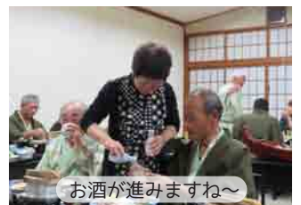
お酒が進みますね～