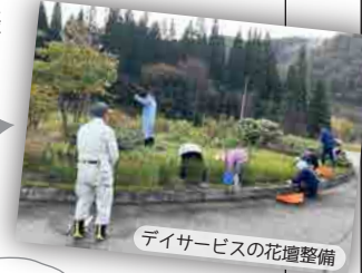
デイサービスの花壇整備