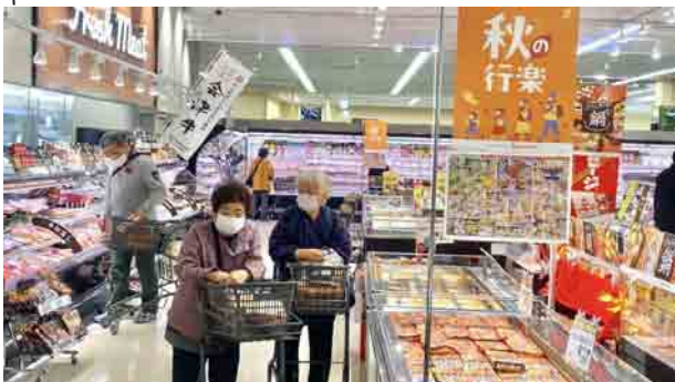
「今日は何食べる?」相談しながらお買いもの

対象 65歳以上の高齢者世帯等 頻度 2ヶ月に1回の定期開催 参加 電話による事前申し込み 場所 喜多方市、猪苗代町 ※サービス対象者にはチラシを配布しています