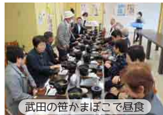
武田の笹かまぼこで昼食