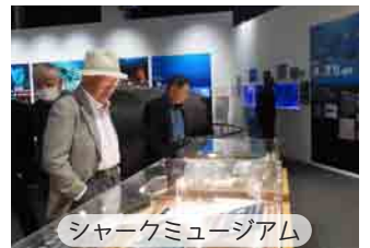
シャークミュージアム