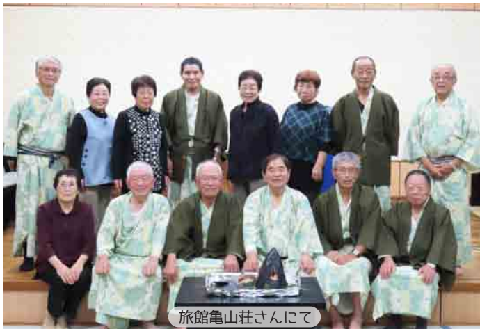
旅館亀山荘さんにて

10月28日(月)～29日(火)宮城県方面に行ってきました。参加者は各地区の役員14名。天候に恵まれた2日間!1日目は塩釜で昼食を食べ、気仙沼市の「シャークミュージアム」へ。日本で唯一サメを専門とする博物館とあって、みなさん興味深く見学されていました。