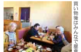
買い物後はみんなで昼食