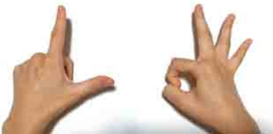
意外とむずかしいぞ！ OL体操

どの行政区でも人気だったのが「脳トレ指体操」。 左右の手で違うポーズを交互に繰り返します。 皆さんは出来ますか～？