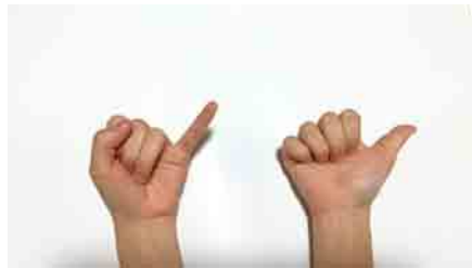
慣れるとラクラク？ 親指小指体操

どの行政区でも人気だったのが「脳トレ指体操」。 左右の手で違うポーズを交互に繰り返します。 皆さんは出来ますか～？