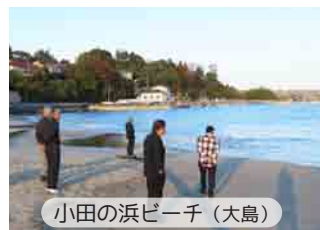
小田の浜ビーチ(大島)