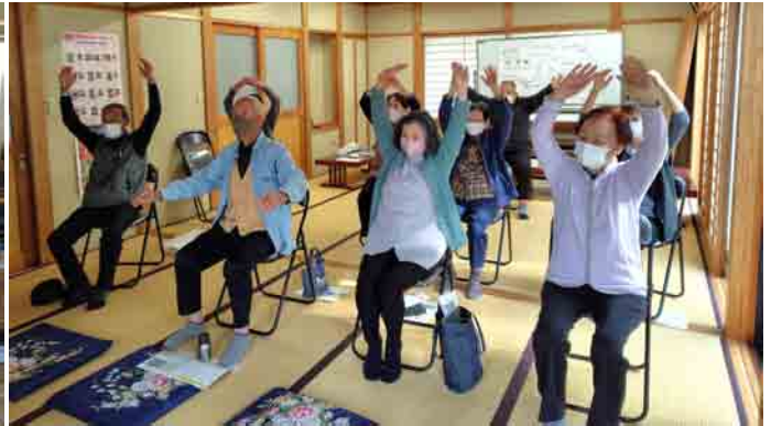
松陽台行政区：「ズンドコ体操」