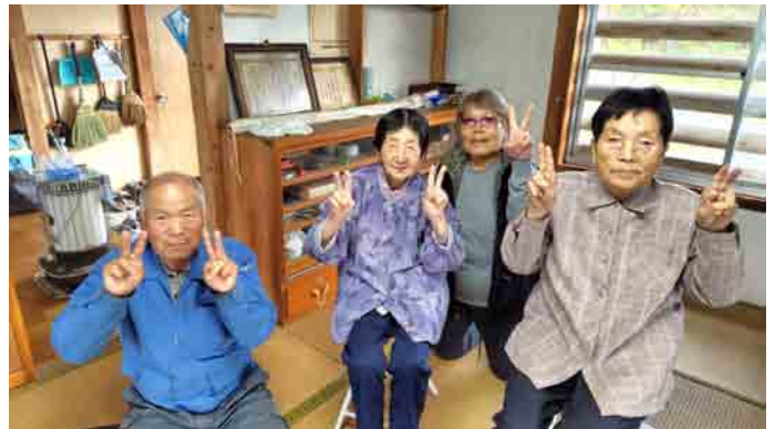
上川前行政区：脳トレもバッチリできたよ～!